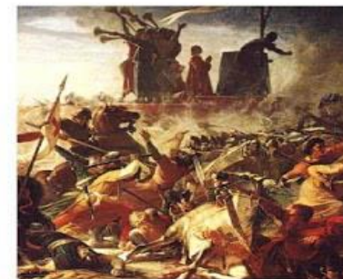
Battaglia di Legnano